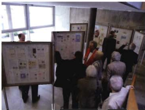
Großes Interesse bei der Silcher-Ausstellung.

und Musikerzieher Friedrich Silcher wäre es sicher wert gewesen, auch im Jahr 2010 auf einer Sonderbriefmarke der Deutschen Post verewigt zu werden. Doch das Ausgabenprogramm für neue Motive ist reichlich bestückt und sollte wohl nicht noch weiter überstrapaziert werden. Deshalb übernimmt es in diesem Jahr der Württembergische Philatelistenverein Stuttgart 1882 e.V., den bekannten schwäbischen Komponisten zu seinem 150. Todestag mit einer Wanderausstellung von thematisch passenden philatelistischen Erinnerungsstücken und Raritäten in vier Städten der Region zu ehren. Gezeigt wird die Schau bis zum 8. Juni im Rathaus Weinstadt-Beutelsbach. Ab 9. Juni bis zum 30. Juni 2010 geht es in der Musikschule SMTT in Sindelfingen weiter. Im Oktober und November folgen Stuttgart und Tübingen.