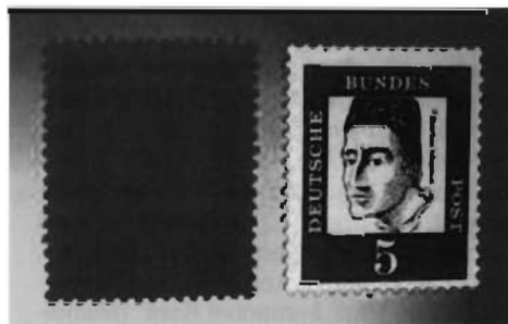
Michel-Nr. 347x und 347y unter UV-Licht

Für Sammler waren und sind vor allem die Marken interessant, bei denen es klare Unterschiede innerhalb einer Ausgabe gibt. Der Heuss-Satz in seiner fluoreszierenden Version wurde zwar auch über die beiden damaligen Versandstellen in Frankfurt a. M. und Berlin (West) vertrieben, kletterte nach Verkaufsende aber dennoch in den Preisen hoch, da offensichtlich nicht alle Sammler eine „neue“ Ausgabe darin sahen oder einfach nichts davon wussten.