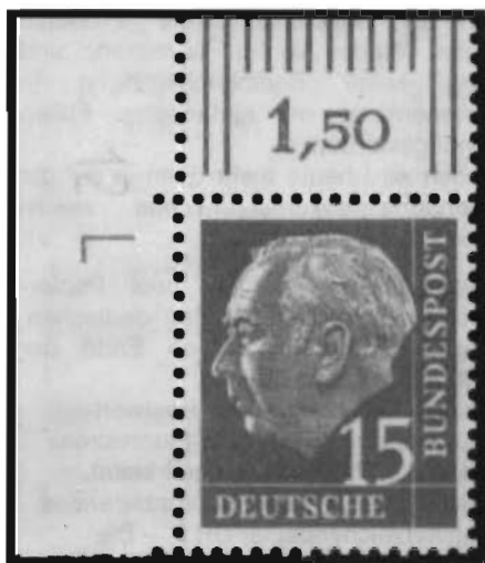
Heuss 184y, Eckrand mit „L“

Vor 50 Jahren erschienen die ersten unter UV-Licht leuchtenden Briefmarken in Deutschland. 1960 wurden zunächst für Testzwecke acht Werte der Dauermarkenserien Heuss I und II mit „Fluoreszenz“ ausgegeben, in Sammlerkreisen besser bekannt unter der Bezeichnung „Heuss lumogen“. Die Fluoreszenz-Methode bei deutschen Briefmarken wurde stetig weiterentwickelt und verändert, doch das Grundprinzip von 1960 ist geblieben.