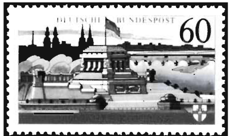
2000 Jahre Koblenz, Michel-Nr. 1583

Auf dem Briefmarkenmarkt wurde es noch mal richtig spannend, als 1992 die „Koblenz-Marke“ (Michel-Nr. 1583) ohne Fluoreszenz entdeckt wurde. Von der 31 Millionen Stück-Auflage sollen rund 100.000 Stück versehentlich auf Fluoreszenz-loses Papier gedruckt worden sein, was einer großen Druckrolle entspricht. Eigentlich eine Abart mit hoher Auflage, wurde sie zur 1583x erklärt und damit zu einer kleinen Teilaufgabe gemacht, die Eingang in die Vordruckalben fand.