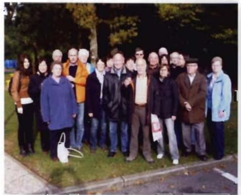
Bild zeigt die Delegation des Philatelistenclubs.