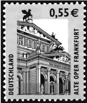
Michel-Nr. 2300 mit „Fluoreszenz-Additiv“ Rahmen-Aufdruck grau unterlegt

Meliefasern eingesetzt (Dauerserie ‚Sehenswürdigkeiten‘), kleine rot fluoreszierende Textilfasern, die bereits in den Papierbrei eingearbeitet werden. Sie kommen auch bei Geldscheinen in verschiedenen Farben zum Einsatz, haben sich aber offensichtlich bei den Briefmarken nicht bewährt. Die Anzahl der Fasern war teilweise zu gering, um jede kleine Marke zu erfassen.