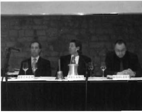
Der geschäftsführende Vorstand vor Beginn des LV-Tages. Die angespannten Minen waren unbegründet – der LV-Tag verlief harmonisch!

Im Jahr 2009 sind zwei Rang 3 Wettbewerbsausstellungen erfolgreich durchgeführt worden: Vom Philatelistischen Club in Schwieberdingen und vom Verein der Briefmarken- und Münzsammler „Hardt“ in Bietigheim-Baden anlässlich des 40-jährigen Vereinsjubiläums.