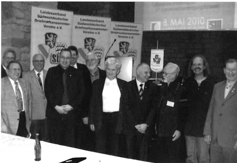
Ein „Rudel“ Geehrter des 57. Landesverbandstages auf dem Hambacher Schloss

Auch konnte ich bei Eröffnungen von Briefmarkenschauen, so z. B. in Geislingen/Steige in der dortigen Kreissparkasse feststellen, dass unser Hobby bei entsprechender Aufmachung und Örtlichkeit