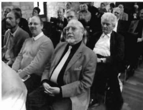
...auch Freunde aus dem Elsass wurden gesichtet!

Mit der „Phila-Musica '09“ zeigten uns die Thematisksammler und Briefmarkensammlerverein Worms die Welt der Musik in Form von hochkarätigen Ausstellungssammlungen.