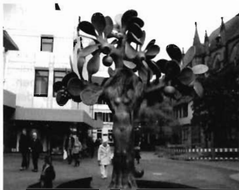
Noch mehr Kunst, Brunnenfigur in Neustadt/Weinstraße.

hinter sich zu wissen. Mit diesen lassen sich dann auch die künftigen Aufgaben leichter bewerkstelligen und auch die Leistungen können weiterhin auf einem guten Niveau gehalten werden.