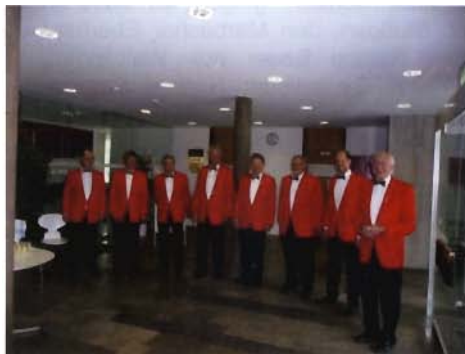
Die „Fellbacher Trollinger“ bildeten den Begrüßungschor.

Ebenfalls in der Präsentation zu sehen sind weitere, zum Teil seltene Sammlerstücke zu den Themen Lebenswerk von Friedrich Silcher, Musik allgemein, Volkslieder, Chöre und Gesangsvereine, Komponistenkollegen, Lehrmeister, Gönner und Schüler von Silcher (z.B. Carl Maria von Weber, Conradin Kreuzer, Heinrich Pestalozzi, Eduard Mörike, Wilhelm Hauff u.a.), weitere prominente Männer und Frauen, denen er begegnet ist, sowie Stätten und Orte seines Wirkens – jeweils mit erläuternden kurzen Texten. Alles in allem wird die Ausstellung des „Württembergischen“ nicht nur Philatelistenherzen höher schlagen lassen, sondern auch die von Freunden von Volksliedern und vom Chorgesang und ganz allgemein kunsthistorisch interessierten Menschen.