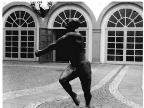
Kunst liegt oft im Auge des Betrachters: Hier eine Skulptur vor dem Rathaus in Neustadt/Weinstraße.

Neu in den Verband aufgenommen werden konnten der Briefmarken- und Münzsammlerclub Isny, der BSV Ammerbuch und der Landerling Süd-West.