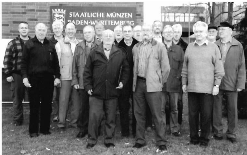
Die Münzengruppe des BSV Rottweil vor der Staatlichen Münze in Stuttgart.

Als krönenden Abschluss kehrten die Reisenden in der Besenwirtschaft „AMMERTAL“ in Ammerbuch-Pfäffingen ein. Bei sehr guter Hausmannskost, eigenem Wein und mit Gesang vergingen ein paar sehr lustige Stunden,